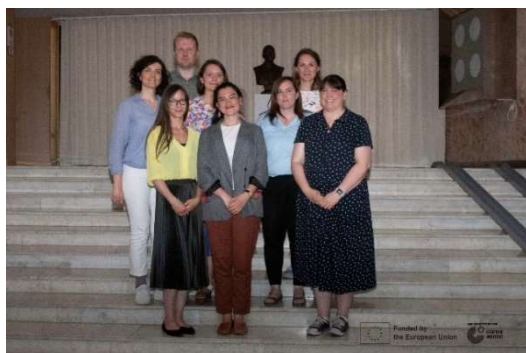
Représentation des professionnels émergents à Tallinn (Estonie), Juin 2023.

EPWG - En 2023, le Groupe de travail des professionnels émergents a poursuivi ses activités, notamment en poursuivant ses recherches pour la construction d'un programme de mentorat entre les "senior expert" et "junior expert" de l'ICOMOS. Nous avons continué les réunions mensuelles avec une présentation sur un CSI ou un GT, ouvert à tous les membres professionnels émergents de l'ICOMOS, une fois par mois. En juin 2023, lors de la réunion annuelle du groupe ICOMOS Europe en Estonie, huit professionnels émergents étaient présents en personne (ce qui était une première pour ce type d'événement). Trois des représentants ont reçu des financements européens pour se rendre à cette réunion. Enfin, nous avons participé à l'Assemblée générale à Sydney en septembre 2023 avec une représentation multiculturelle très large.