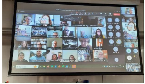
Foreshore House at 66 Harrington Street, The Rocks, Sydney

Le CIVVIH a publié les actes du symposium scientifique « Onze ans après les Principes de La Valette ; Evolution et pratiques dans la gouvernance du patrimoine urbain » qui a eu lieu à Bruxelles, Belgique du 15 au 19 juin en 2022. Cette publication a été possible grâce au soutien d'Icomos Wallonie Bruxelles qui l'a intégré dans leur collection Thema & Collecta.