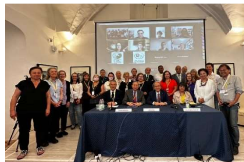
ICIP - Scientific symposium, 25 et 26 mai 2023, Florence, Italy