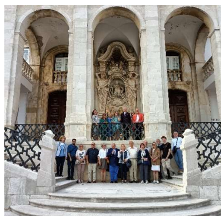
Université de Coimbra, Portugal

La réunion annuelle du CIVVIH a eu lieu à Sydney, Australie, le 2 septembre 2023 pendant l'Assemblée générale d'ICOMOS. 32 membres étaient présentes à Sydney et 37 ont participé en ligne. Le rapport des activités a été présenté.