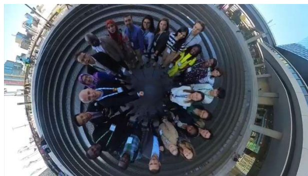
Représentation des professionnels émergents et leurs mentors à Sydney (Australie), septembre 2023