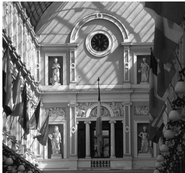
Les Galeries Royales Saint-Hubert.