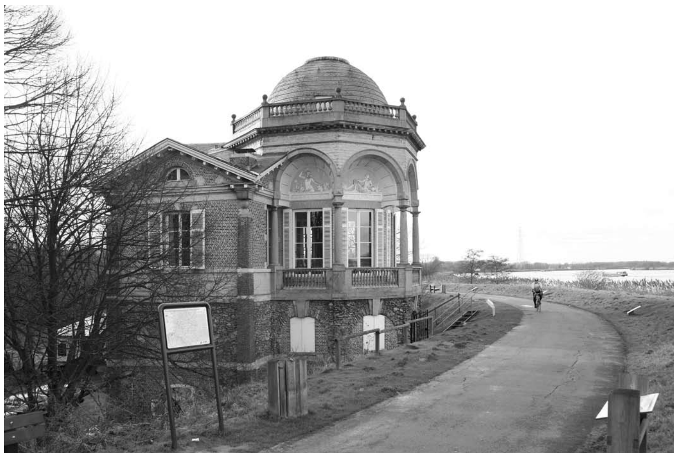
Pavillon De Notelaer à Hingene (Bornem).