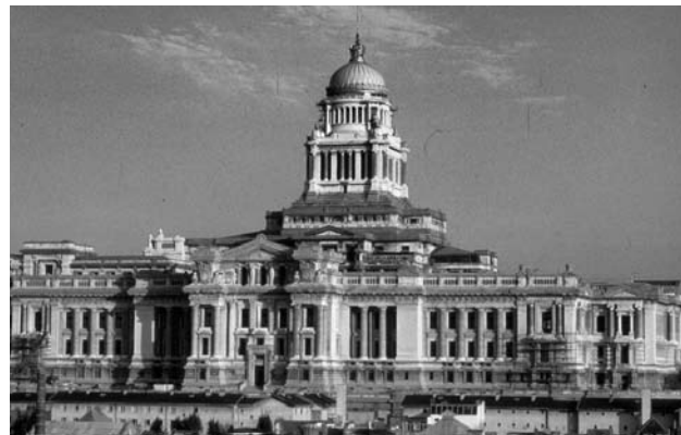
Le Palais de Justice de Bruxelles.